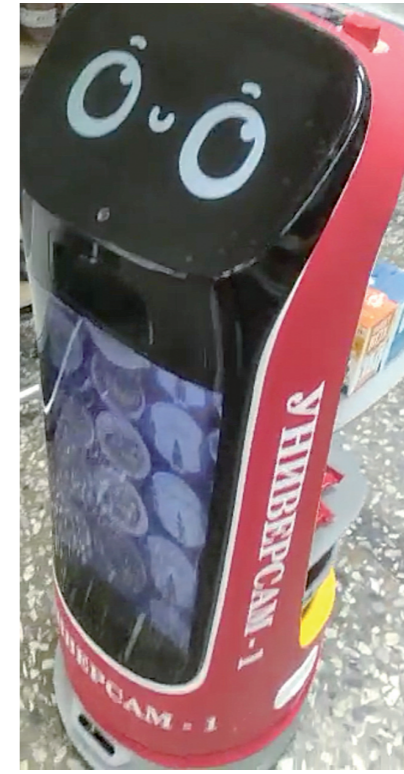
Т. СЛИПЧЕНКО. Фото министерства экономического развития СК.

И все же такие сервисные роботы пока не настолько интеллектуальны, чтобы полностью заменить людей.