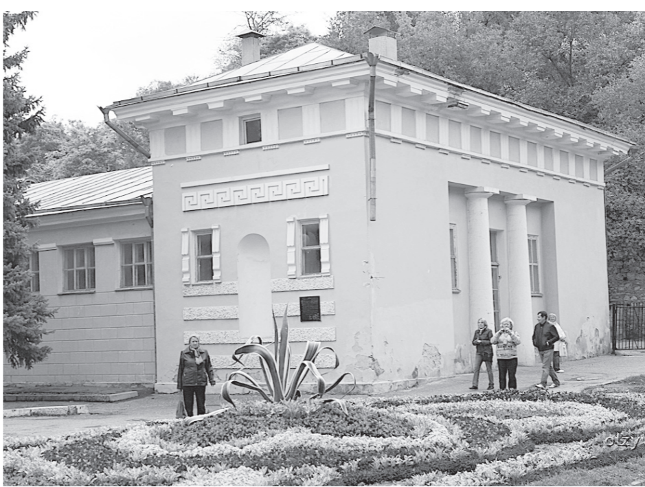
Лермонтовские ванны, город-курорт Пятигорск.