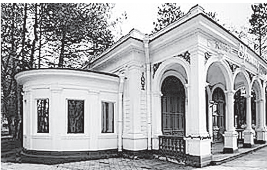
Павильон «Читальня», город-курорт Кисловодск.

родных территорий, многие - на землях сельскохозяйственного назначения. Так что собственником может выступать и муниципалитет, и частное лицо.