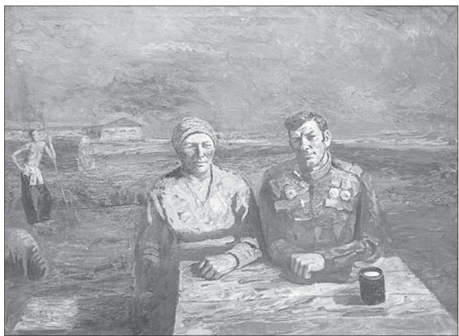
В.М. Чемсо. Отгремели бои. 1985 г.

Крупный проект публикации фондов второй год продолжается в Ставропольском музее изобразительных искусств с демонстрацией богатого художественного наследия нескольких поколений мастеров изобразительного искусства Ставрополья.