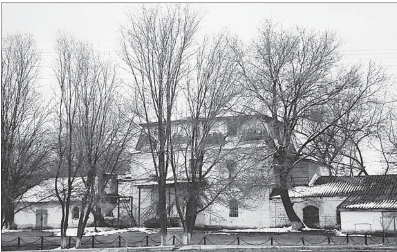
Мельница в селе Донском. Март 2005 года.

7 сентября. Понедельник. Както неожиданно определились еще одна антипатия нацистов, неожиданная и оттого еще более прискорбная. Отчего-то гитлеровцы пришили не по душе сельские собаки. Они отстреливали их, даже тех, что были на привязи. Чито-