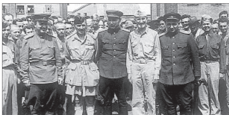
Советские генералы среди солдат и офицеров союзных армий, находившихся в плену у японцев. 1945 г.

По материалам управления информации ПСК.