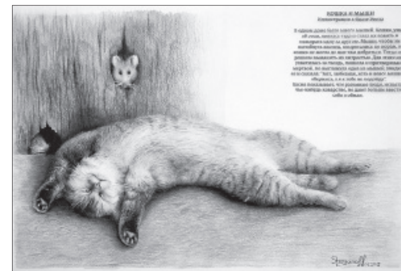
Иллюстрация Сергея Строганова к басне Эзопа «Кошка и мышь».

Работы Сергея - это оригинальные иллюстрации к басням Эзопа, Лафонтена и с мля: картины насыщены летним теплом, уютном городских дворах, бескрайними просторами полей... Еще одна экспозиция - «Цветы» - с репродукциями произведений художников из музеев России, ближнего и дальнего зарубежья.