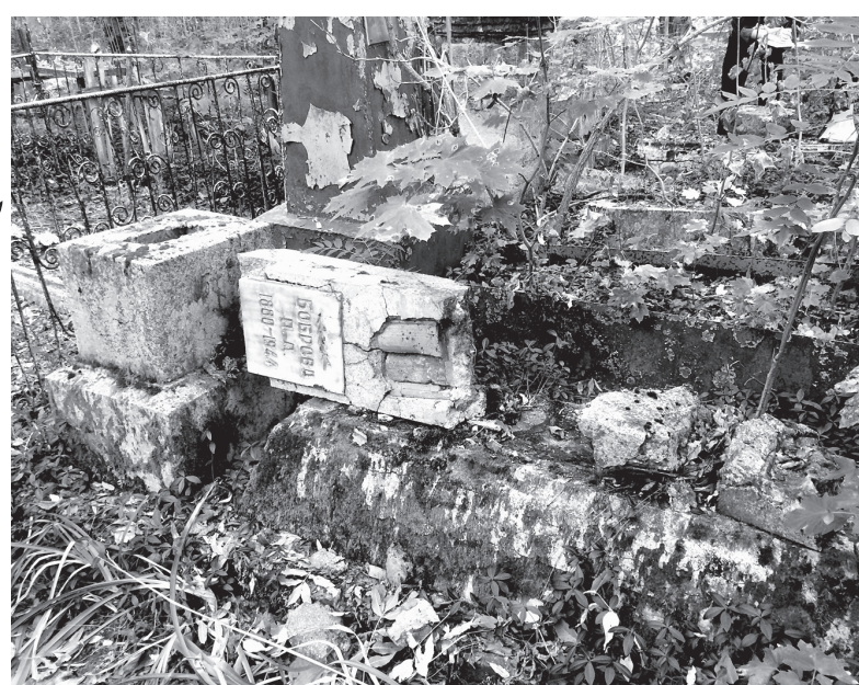
Так выглядят заброшенные могилы на Даниловском кладбище.

Примерно в середине нашего разговора кто-то из моих собеседников вспомнил фразу Валентина Пикуля: «О культуре народа можно судить по состоянию кладбищ...». И этот аргумент писателя-историка действительно трудно оспорить. Поскольку настоящая культура любой страны или народа - это не только сияющие новизной музеи, театры, концертные залы и вежливые люди на залитых рекламным блеском улицах. О культуре общества можно судить и по состоянию обычных городских и сельских погостов. То, как они выглядят, - тоже своеобразный показатель отношения современников и к своим прямым предкам, и к истории своего города, страны, народа. Вряд ли по-настоящему культурные люди будут относиться ко всему этому наплевать. О чем конкретно пойдет речь? О состоянии мемориалов и кладбищ в городе Ставрополе и крае. И об акции «Чистая память», задуманной для того, чтобы навести порядок на могилах наших земляков.