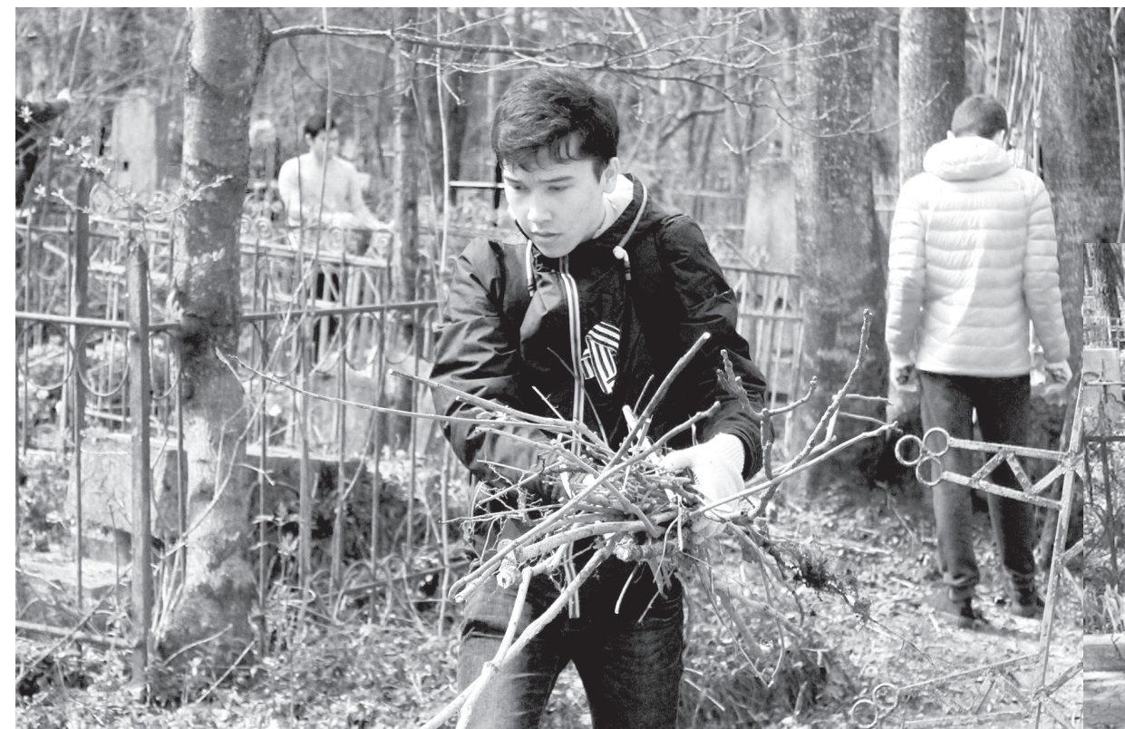
Субботник движения «Чистая память».

Мои собеседники из Центра патриотического воспитания молодежи города Ставрополя - непосредственные участники этой акции, которая родилась из местной студенческой инициативы еще в 2013 году. Решили тогда ребята из молодежного парламента городской Думы перед очередным Днем Победы навести порядок на старинном Даниловском кладбище в краевом центре, где давно уже никого не хоронят и где очень много заброшенных могил солдат Великой Отечественной и известных наших земляков. Бросили клич через социальные сети, нашли сторонников, вышли на субботник. И сразу стало понятно, что работы там не на один субботник и даже не на один год.