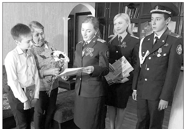
экспертом-криминалистом в Следственном комитете России. В его планах - учеба в кадетском корпусе СКР имени Александра Невского.