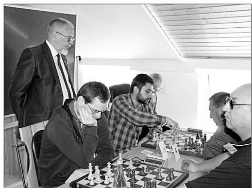
• Спикер Думы внимательно следит за шахматными баталиями.