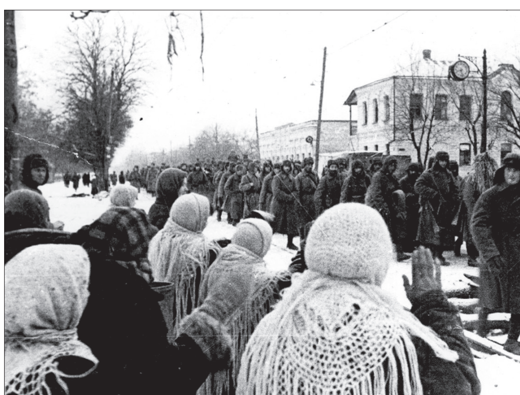
Жительницы Ставрополя встречают советских солдат-освободителей. Январь 1943 г.