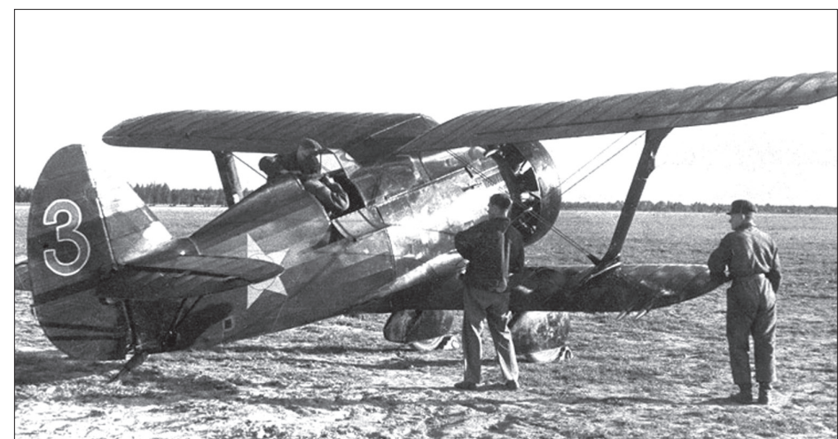
На таких истребителях И-15 в начале войны сбивали фашистских асов наши летчики.

Фото членов поискового отряда «Донской».