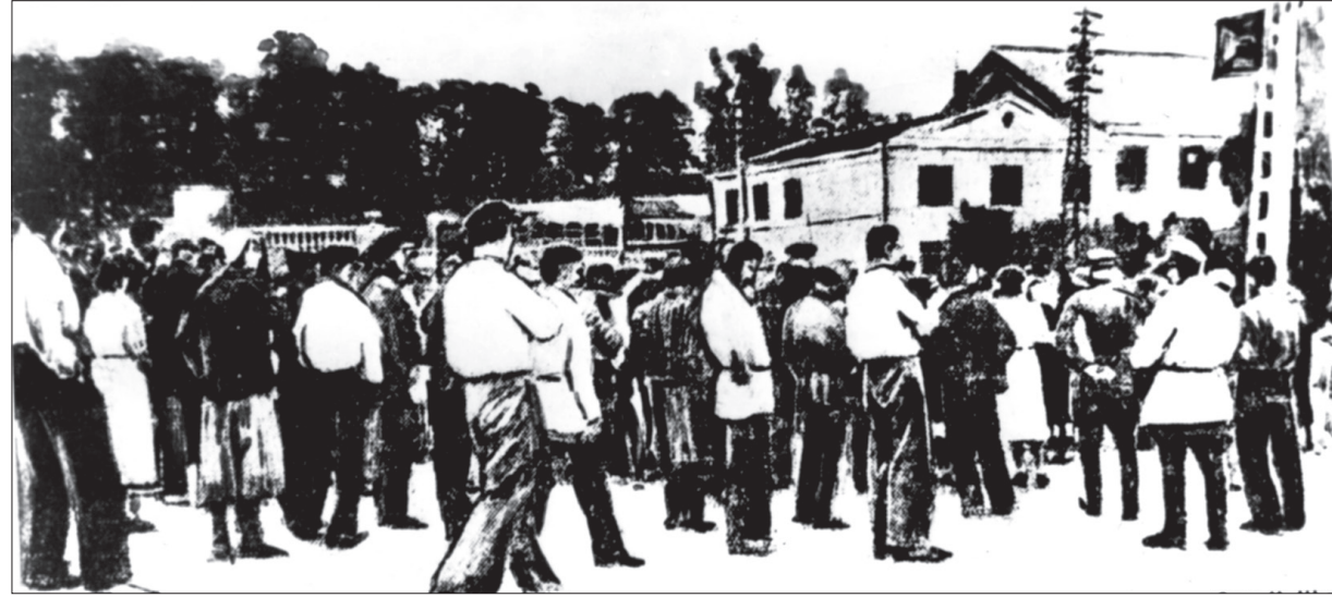
☉ Ставропольцы слушают сообщение о начале Великой Отечественной войны.

Даже сейчас, через 74 года после окончания Великой Отечественной войны, открываются исторические подробности о том лихолетье, начавшемся 22 июня 1941 года.