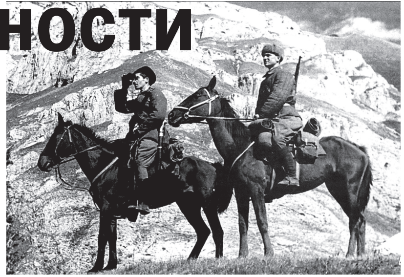
☉ Разъезд 63-й кавалерийской дивизии на охране горных перевалов Кавказа. Сентябрь 1942 г.

В книге анализируется система оккупационной политики немецких захватчиков. Ее основой на территории Ставропольского края стал геноцид. Массовые расстрелы проводились в городах и селах края. В Ставрополе во время оккупации погибло 8 тыс., в Минеральных Водах - 10 тыс., в Пятигорске - 3 тыс., в Кисловодске - 3 тыс., в Черкесске - 2350 человек. Всего в Ставропольском крае от рук оккупантов погибли 31645 мирных жителей и 277 военнослужащих. Авторы установили, что гитлеровские оккупационные власти отправили на каторжный труд в Германию более 122 тыс. представителей Северного Кавказа, в том числе из Ставропольского края 990 человек. А в целом в период оккупации замечено сокращение аграрного производства. Показатели промышленного производства края к окончанию войны по сравнению с 1940 г.: численность промышленного персонала - 34,9 тыс. человек, или 51,4%, выпуск промышленной продукции - 41,8%. Производство таких товаров народного потребления, как обувь, сократилось