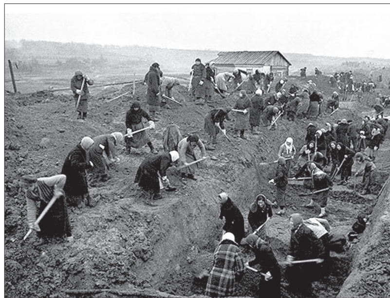
☉ Женщины роют траншеи на окраине Ставрополя. Осень 1941 г.

нули с седел и повисли на стременах. Через мгновение кони занесли их на позиции врага. И тут произошло чудо, «мертвые» казаки освободились от стремени и открыли беглый огонь из автоматов по растерявшимся гитлеровцам. Опорный пункт оказался в наших руках». Однако, как известно, в истории войны были не только героические, но и трагические страницы. Авторы приводят факты, мягко говоря, неадекватной политики местного партийного и военного руководства в начале войны. Вот один из них: лишь 7 августа 1942 года, когда немецкие войска уже заняли Ставрополь, было принято решение о переводе Ставропольского края и республик Северного Кавказа на военное положение. Это привело к невосполнимым потерям. Не были эвакуированы многие жители края, которым нельзя было оставаться на оккупированной территории. Врагу достались имущество, запасы про-