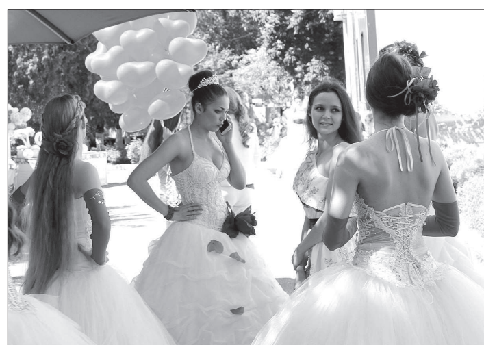
На выставке «Свадебный рай» в Невинномыске.

Чаще всего деятельность ЗАГС ассоциируется исключительно с регистрацией брака. Однако работа ведомства этим не ограничивается