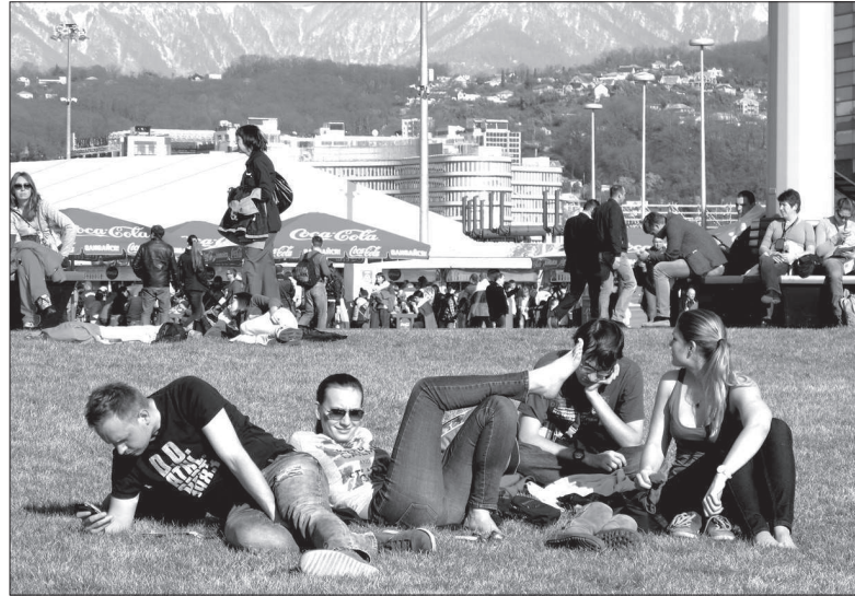
Отдохнуть никогда не помешает.