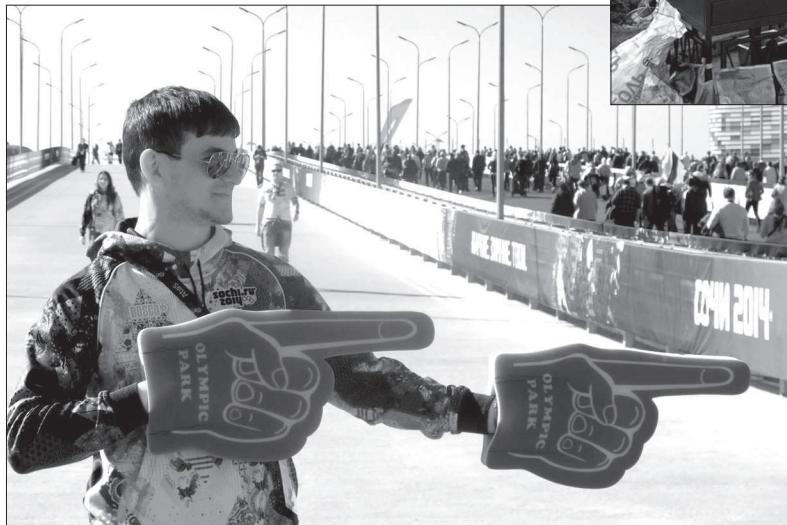
Волонтеры in action.