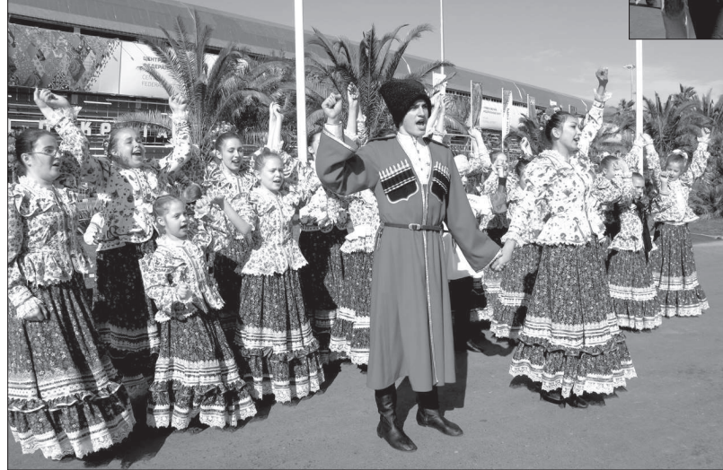
Культурная программа Олимпиады: казачий хор.