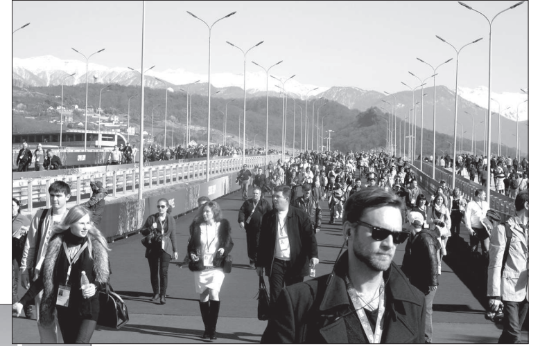
Все в Олимпийский парк!