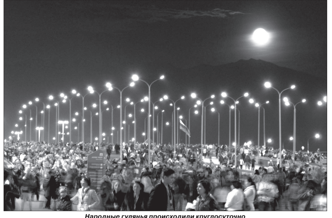
Народные гулянья происходили круглосуточно