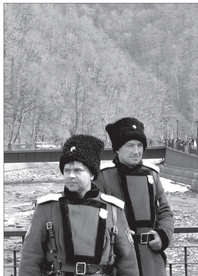
Казачи следят за порядком.