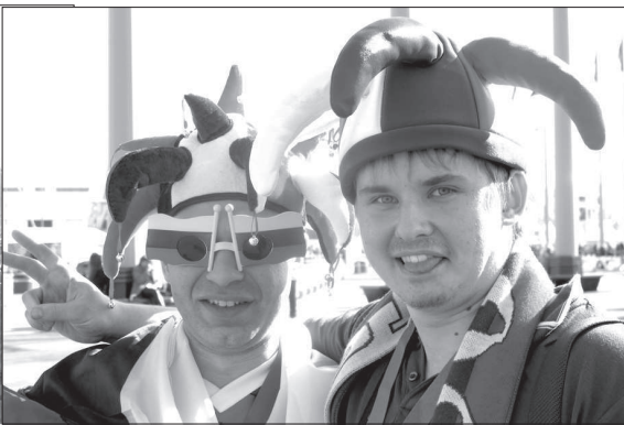
Я болею за Россию!