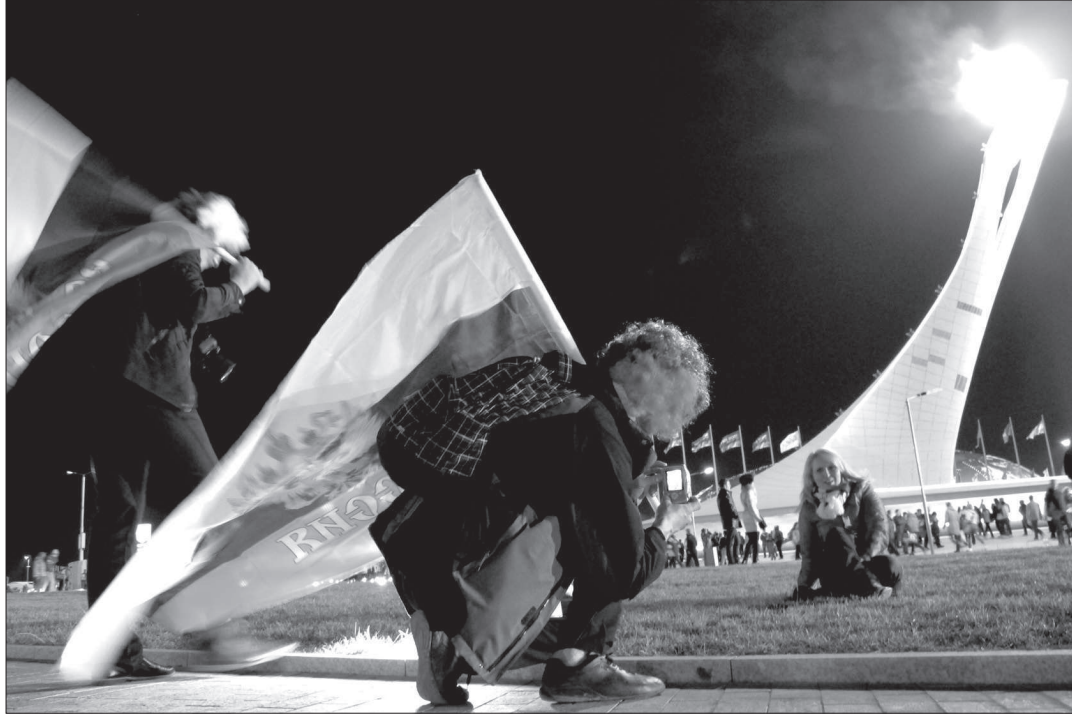
Фотографироваться на фоне чаши олимпийского огня мог каждый желающий.

Одним из знаковых событий мирового масштаба стали XXII зимние Олимпийские игры, доверенные Сочи. Вне всякого сомнения, сотни миллионов землян внимательно следили за ходом олимпийских баталий у телевизионных экранов, а тысячам счастливых довелось наблюдать за ходом состязаний, так сказать, воочию. Среди них и фотокорреспондент «Ставропольской правды» Эдуард Корниенко, который провел несколько дней в столице Олимпиады перед самым экватором Игр. Своими фотопечатлениями он делится с нашими читателями.