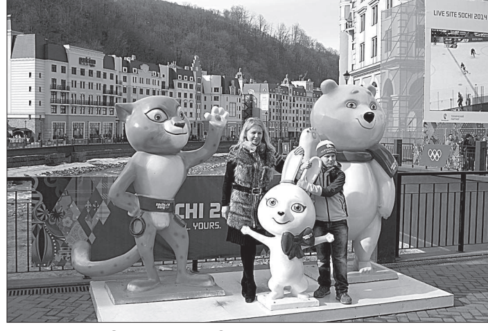
С символами Олимпиады на память.