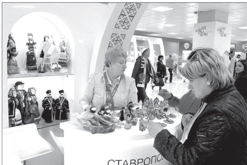
Уголок Ставрополя в Кубанском доме гостеприимства.