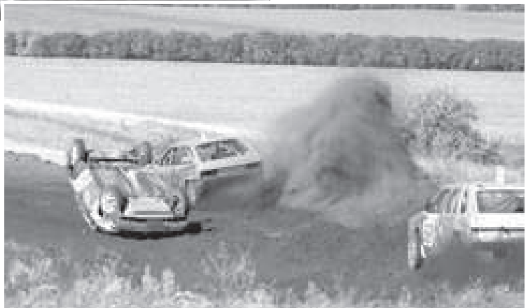
НИКОЛАЙ ГРИЩЕНКО. Фото автора.

О бескомпромиссности борьбы на трассе можно судить по такому факту: некоторые автомобили, кувырнувшись в воздухе, приземлялись на крышу (на фото), но после непродолжительного ремонта вновь выезжали на старт.