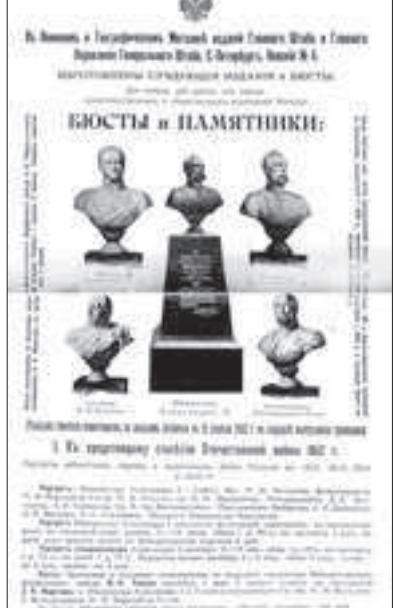
Реклама бюстов и памятников, изготовленных к празднованию 100-летия Отечественной войны 1812 года.