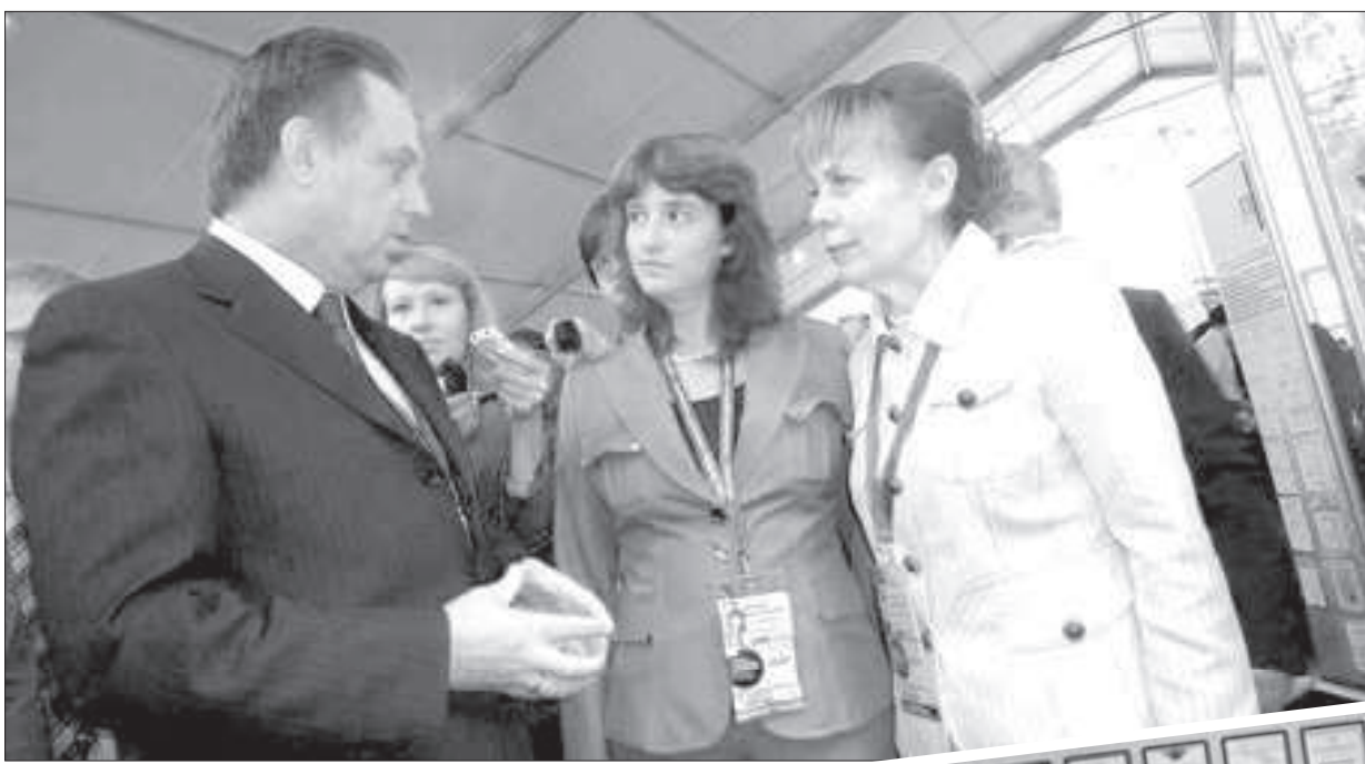
● Встреча с министром спорта, туризма и молодежной политики РФ В. Мутко на Международном форуме «Россия - спортивная держава».

26 августа компания «Сан-Сан» отметила двадцатилетие. Сегодня это название известно на всем Юге России, при этом в нескольких словах просто невозможно описать, в каких направлениях сейчас работает это поистине уникальное предприятие