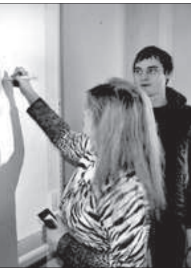
● «Сан-Сан» регулярно проводит семинары для педагогов, обучая их навыкам работы на новом оборудовании.

полья, мы представлены сетью филиалов, дилерских и партнерских компаний в Краснодарском крае, Ростовской и Волгоградской областях, Дагестане, Кабардино-Балкарии, Карачаево-Черкесии, Адыгее, Северной Осетии, Калмыкии, Ингушетии и Чеченской Республике.