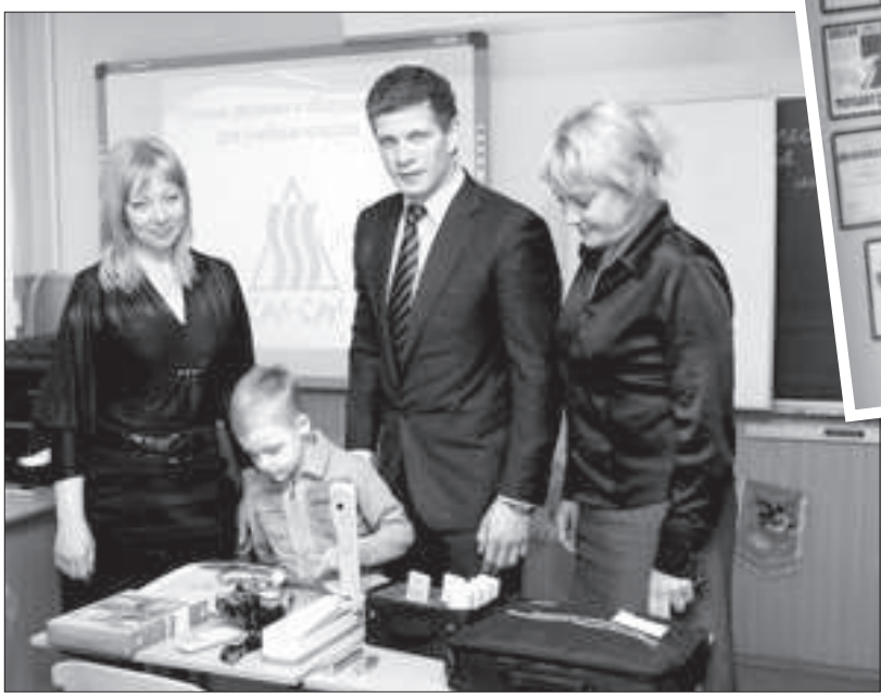
● Увлечись робототехникой, «Сан-Сан» организовал специальный кружок для ставропольских школьников.