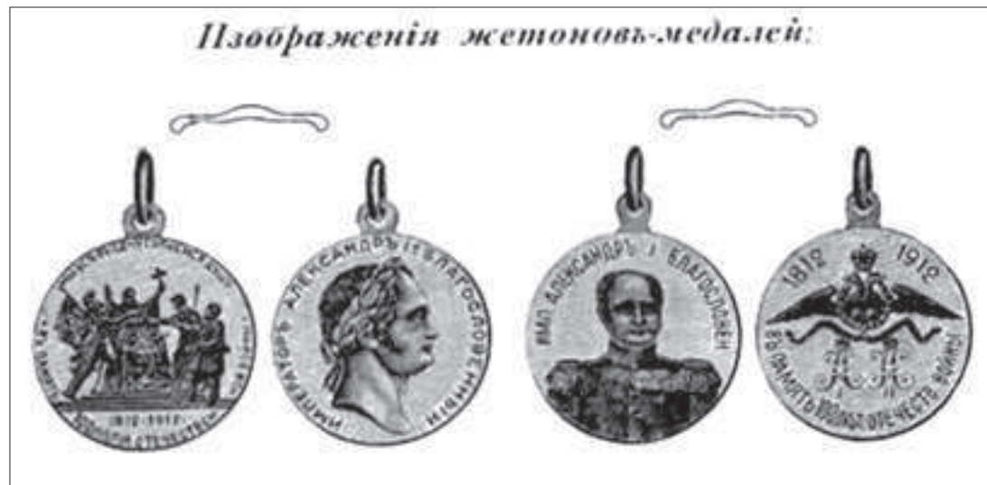
Медали-жетоны, выпущенные в честь 100-летия Отечественной войны 1812 года.

Согласно церемониалу, опубликованному в местных газетах в начале августа, к 11 часам утра на площадь прибыли участвующие в параде воинские части: Самурский полк, интендантская команда, осетинские, потешные, пожарная команда; учебные заведения – 1-я и 2-я мужские гимназии, учительский институт, учительская и духовная семинарии, духовное, епархиальное, городское, ремесленное и начальные училища. Александровская, Ольгинская и 3-я женские гимназии, двухклассная церковно-приходская школа. Все участники с венками, знаменами, значками расположились огромным четырехугольником. В центре – оркестры стражи и мужской гимназии.