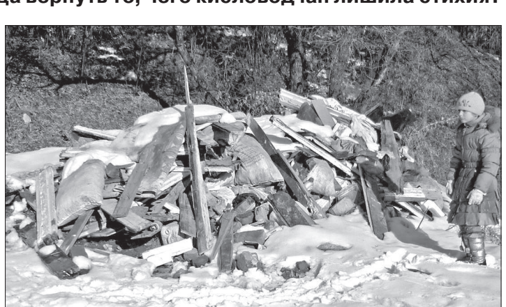
● Так нынче выглядит бывшая зона отдыха кисловодчан.

ФОРМАЛЬНОЙ причиной, побудившей спустить воду из Старого и расположенного ниже по течению реки Аликоновки Нового озера, послужило наводнение 2002 года. Да, тогда из-за затяжных дождей реки разлились, повредили дамбы, забили илом отстойники и обводные каналы. Но ведь с тех пор прошло десять лет. В других местах люди в более сжатые сроки справляются с последствиями даже более страшных стихийных бедствий. А в Кисловодске десять лет ушло в основном на предвыборные обещания сменявшихся за это время мэров.