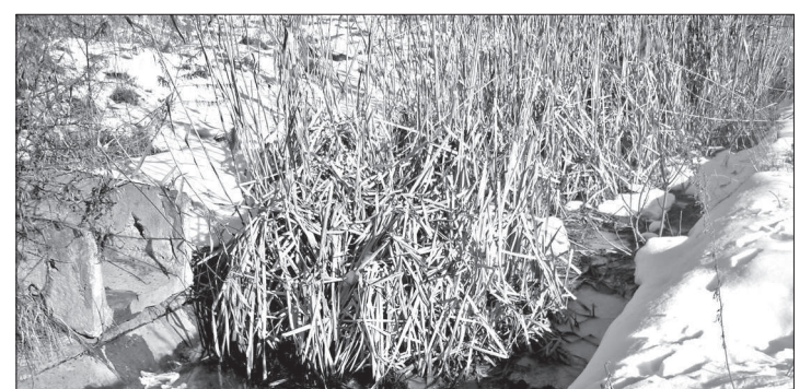
● Обводной канал озера давно не очищали от ила и камыша.