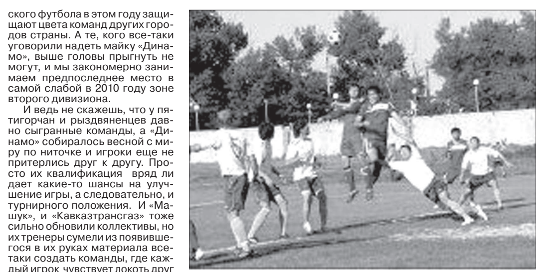
Фрагмент матча «Машука» с «Митосом».

ВОСПОЛЬЗОВАВШИСЬ всего 20 игроками, и «Машук», и «Кавказтрансгаз» «заявились» в лидирующую группу клубов, а на 25-й строчке где раздобытых футболистов не принесли пользы.