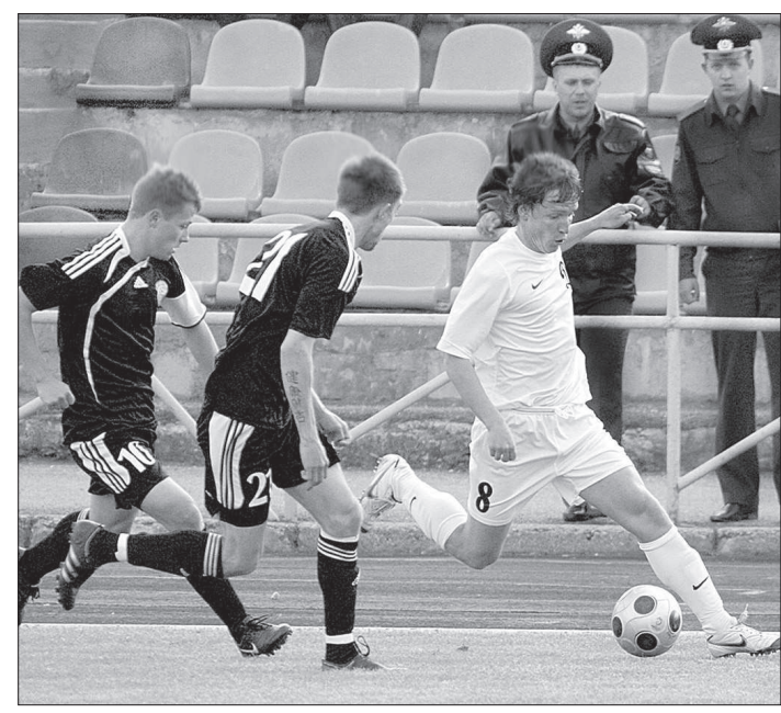
Момент матча динамовцев с «Краснодаром-2000».