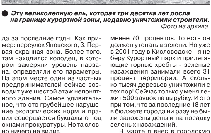
Эту великолепную ель, которая три десятка лет росла на границе курортной зоны, недавно уничтожили строители.

Есть градостроительные критерии по части зеленых насаждений. Как мне рассказали наши общественные экологи, а это весьма компетентные люди, в промышленном городе не менее 40 процентов территории должно быть под зелеными насаждениями. В курортном городе – не