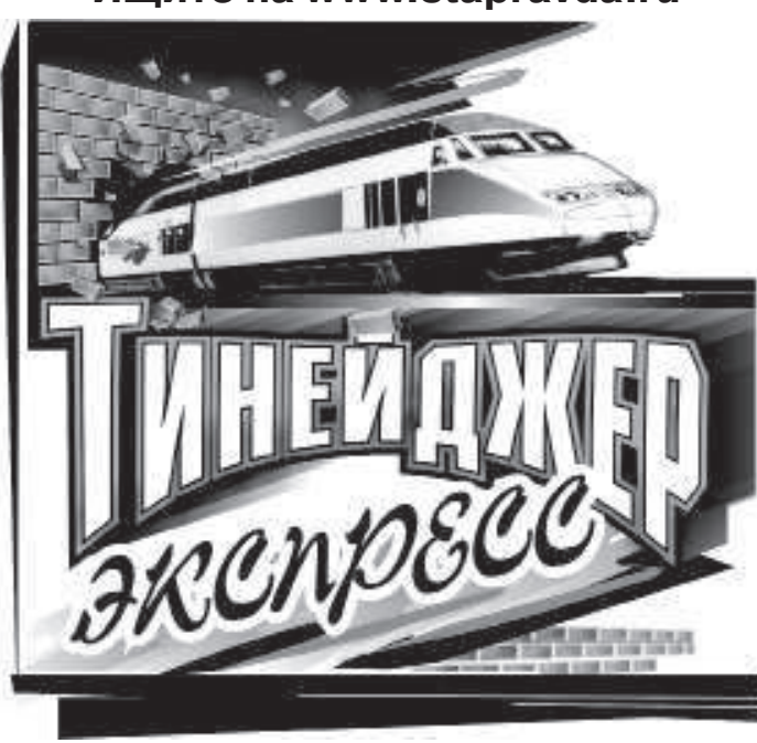
Выпуск подготовили Юлия ЮТКИНА и Екатерина КОСТЕНКО.