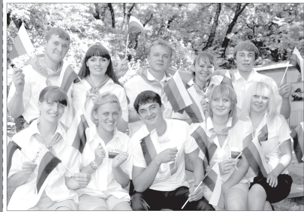
В Ставрополе началось празднование Дня Государственного флага России

Сегодня отмечается День Государственного флага Российской Федерации