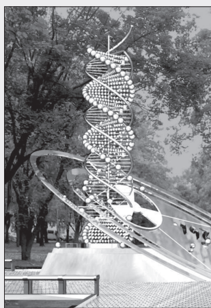
Глава Ставрополя Н. Пальцев утвердил проект памятного знака пострадавшим от радиационных аварий и катастроф.

Шестиметровый монумент, изображающий спираль ДНК человека, частично разрушенную радиацией, предположительно будет выполнен из нержавеющей стали. Установят его в сквере у Дворца культуры имени Ю.А. Гагарина.