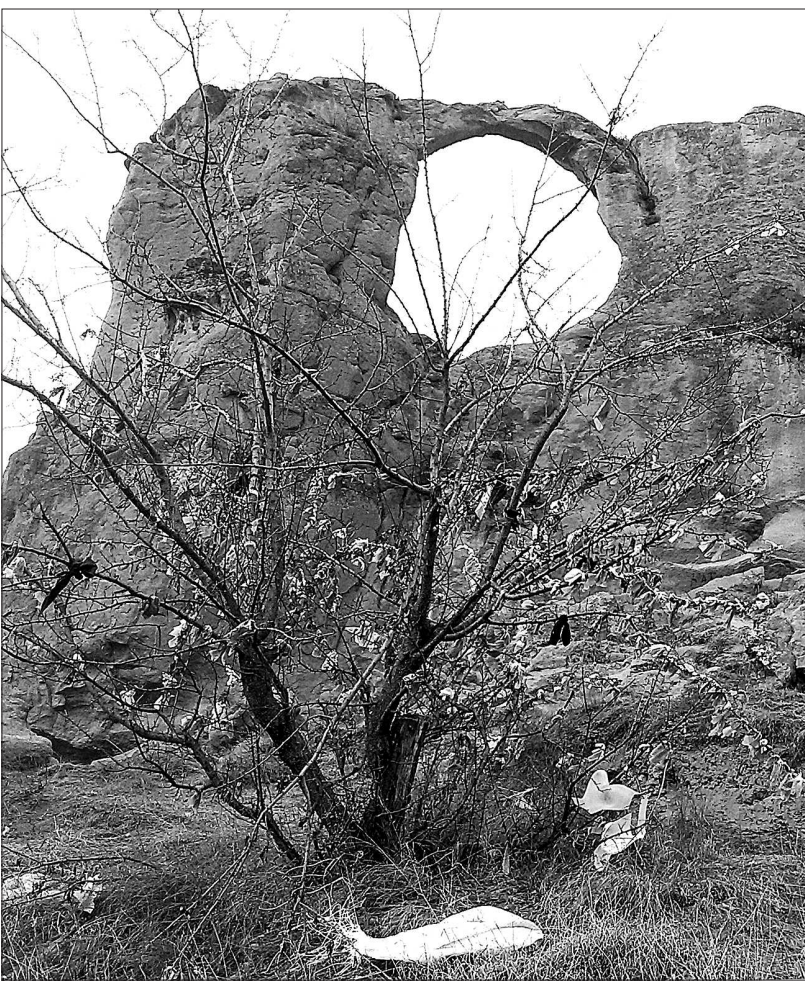
● В окрестностях горы Кольцо.

Как такое безобразие может соседствовать с некогда образцовым лесхозом?