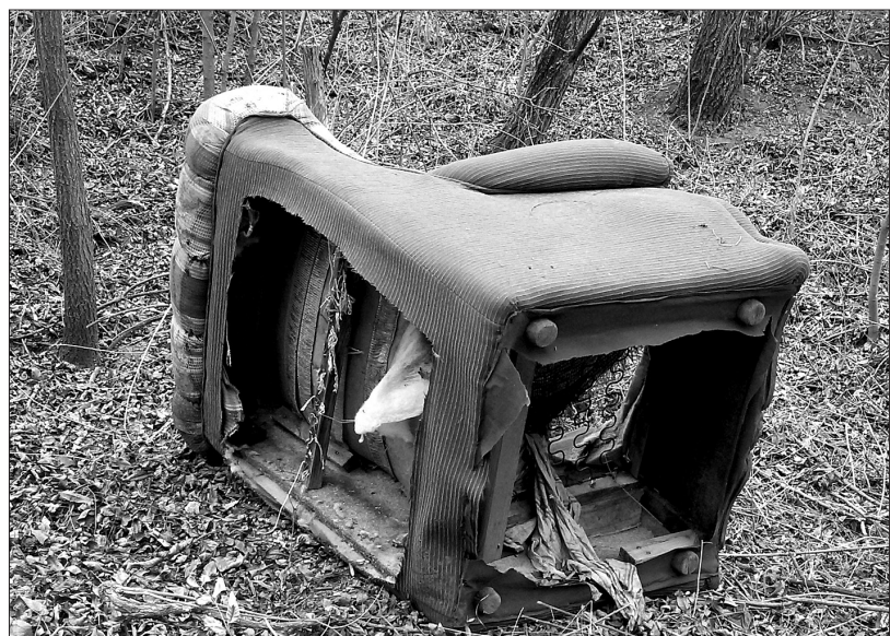
● В лесу на скалах Боргустанского хребта.