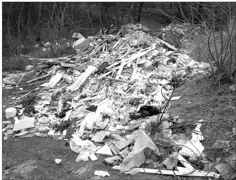
● Сивый сетчатый забор. И хотя предусмотренных проектом видеоканалов по всему периметру ограды нет и в помине, народ пока опасается разгружать там самосвалы со строительными и бытовыми отходами. Но привычка-то к халюве осталась. Вот и валят всю дрянь в близлежащих лесопосадках.