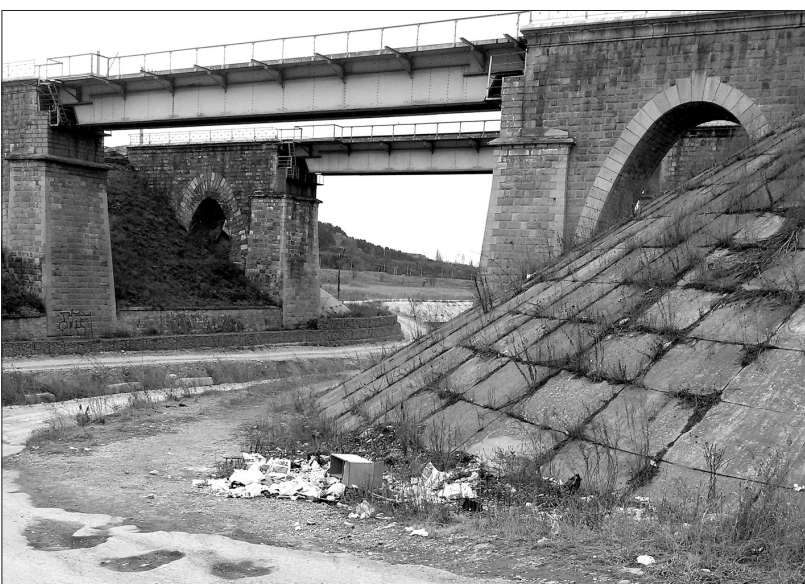
● Свалка под железнодорожным мостом.

Увязавший с гостями курорта абориген растолковывает: лесхоз и лесничество государственные, а прилегающие к городу леса - муниципальные. Много лет после принятия нового Лесного кодекса они были вообще ничейные. Лишь в прошлом году их поставили на кадастровый учет и передали в