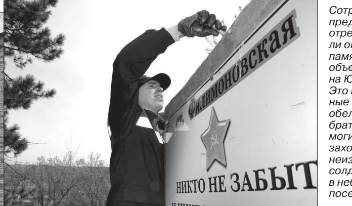
Сотрудники предприятия отремонтировали около 50 памятных объектов на Юге России. Это мемориальные комплексы, обелиски, братские могилы, захоронения неизвестных солдат в небольших поселениях.