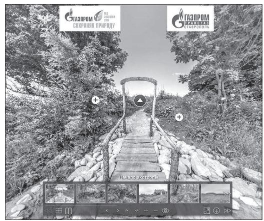
Совместный проект ООО «Газпром трансгаз Ставрополь» и дирекции особо охраняемых природных территорий края по созданию виртуального 3D-тура по территории государственного природного заказника «Стрижамент» был удостоен Национальной экологической премии имени В.И. Вернадского.