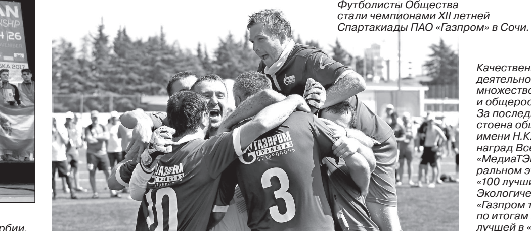
Футболисты Общества стали чемпионами XII летней Спартакиады ПАО «Газпром» в Сочи.