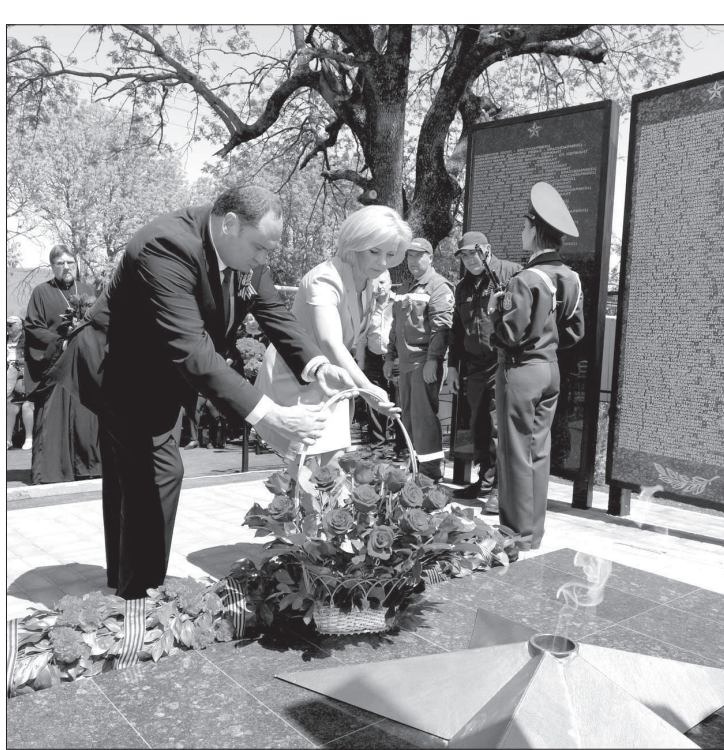
Масштабный социальный проект реализовали газодобыватели накануне Дня Победы. В курорте Утренняя Долина Ставропольского края после генеральной реконструкции открыли мемориал на братской могиле воинам 140-й отдельной танковой бригады, освобождавшей в годы войны Кавминводы от немецко-фашистских захватчиков.