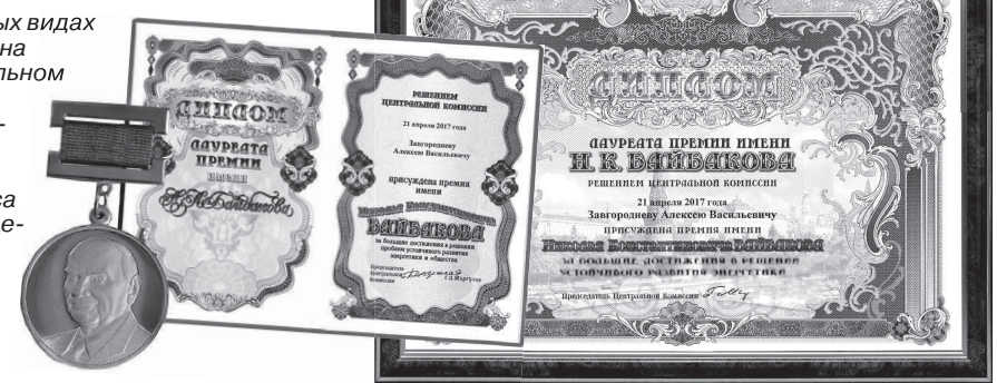
Качественная работа в различных видах деятельности Общества отмечена множеством наград на региональном и общероссийском уровнях. За последний год компания удостоена общественной премии имени Н.К. Байбасова, двух наград Всероссийского конкурса «МедиаТЭК-2017», побед на федеральном этапе программы «100 лучших товаров России». Экологическая служба ООО «Газпром трансгаз Ставрополь» по итогам 2017 года признана лучшей в «Газпроме».