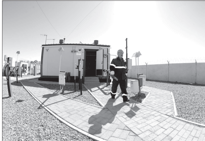
Потребителям двух федеральных округов через 362 газораспределительные станции Общества в 2017 году поставлено 17,5 млрд кубометров газа. Сбоев поставок не было.