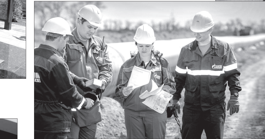
ООО «Газпром трансгаз Ставрополь» стало победителем смотра-конкурса на лучшую организацию работы службы охраны труда в 2017 году среди промышленных предприятий Ставропольского края.