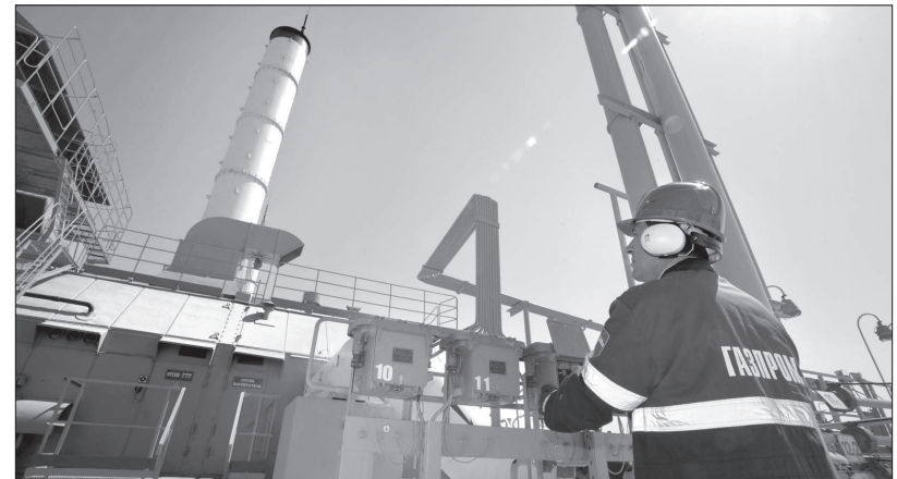
ООО «Газпром трансгаз Ставрополь» успешно решает главную задачу – бесперебойно обеспечивает газом потребителей Северо-Кавказского и Южного федеральных округов, а также поставляет голубое топливо за пределы страны. Ежегодные объемы транспортировки и поставки газа составляют до 70 млрд кубометров.