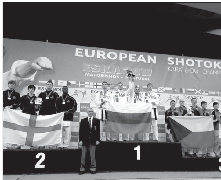
Целую россыпь наград выиграли воспитанники спортклуба «Сетокан трансгаз Ставрополь» на турнирах в Москве, Португалии, Италии и Сербии.