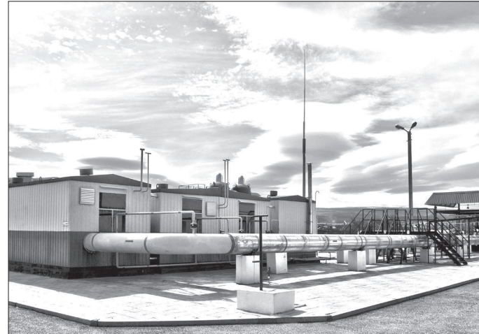
В зоне ответственности предприятия завершено строительство ГРС-2 города Пятигорска. Новая станция позволит обеспечить надежное газоснабжение и дополнительные объемы газа для курортов Кавказских Минеральных Вод.