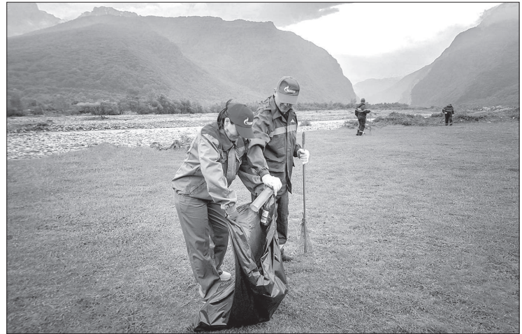
Большую работу проводят газодобыватели в области охраны окружающей среды. В рамках Года экологии реализовано 650 экологических акций.