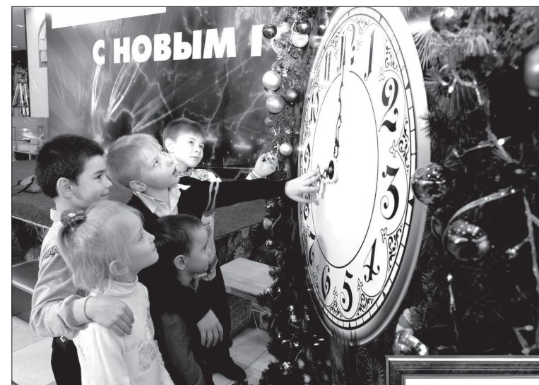
Почти тысяча ребят из детских домов, школ-интернатов и воскресных школ региона побывали на благотворительных праздниках в поселке Рыздвяном. Каждому ребенку вручили подарки. Работники предприятия постоянно навещают воспитанников детских домов, расположенных в зоне ответственности Общества.