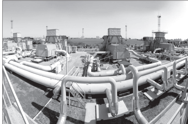
В прошлом году завершена реконструкция дожимной компрессорной станции № 2. Это позволило существенно увеличить производительность объекта и повысить надежность газотранспортной системы в преддверии осенне-зимнего периода.