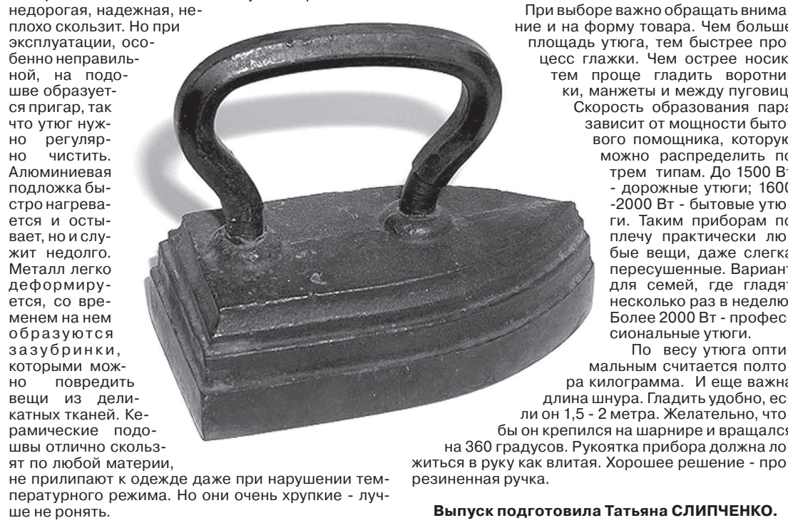
Выпуск подготовила Татьяна СЛИПЧЕНКО.

В продажу, как правило, поступают утюги с функцией парообразования. Они бывают со встроенным или внешним резервуаром для воды.