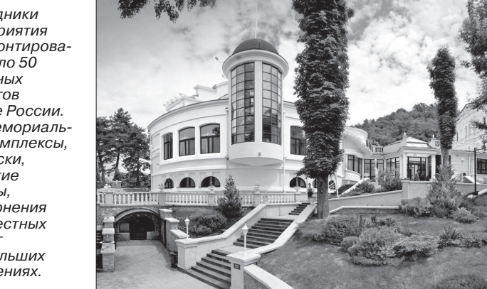
Коллектив пансионата «Факел» ООО «Газпром трансгаз Ставрополь» (г. Кисловодск) получил диплом лауреата, медаль и сертификат национального конкурса «Лучшие санатории Российской Федерации - 2017». По итогам Всероссийского форума «Здравница-2018» пансионат отметили двумя медалями.