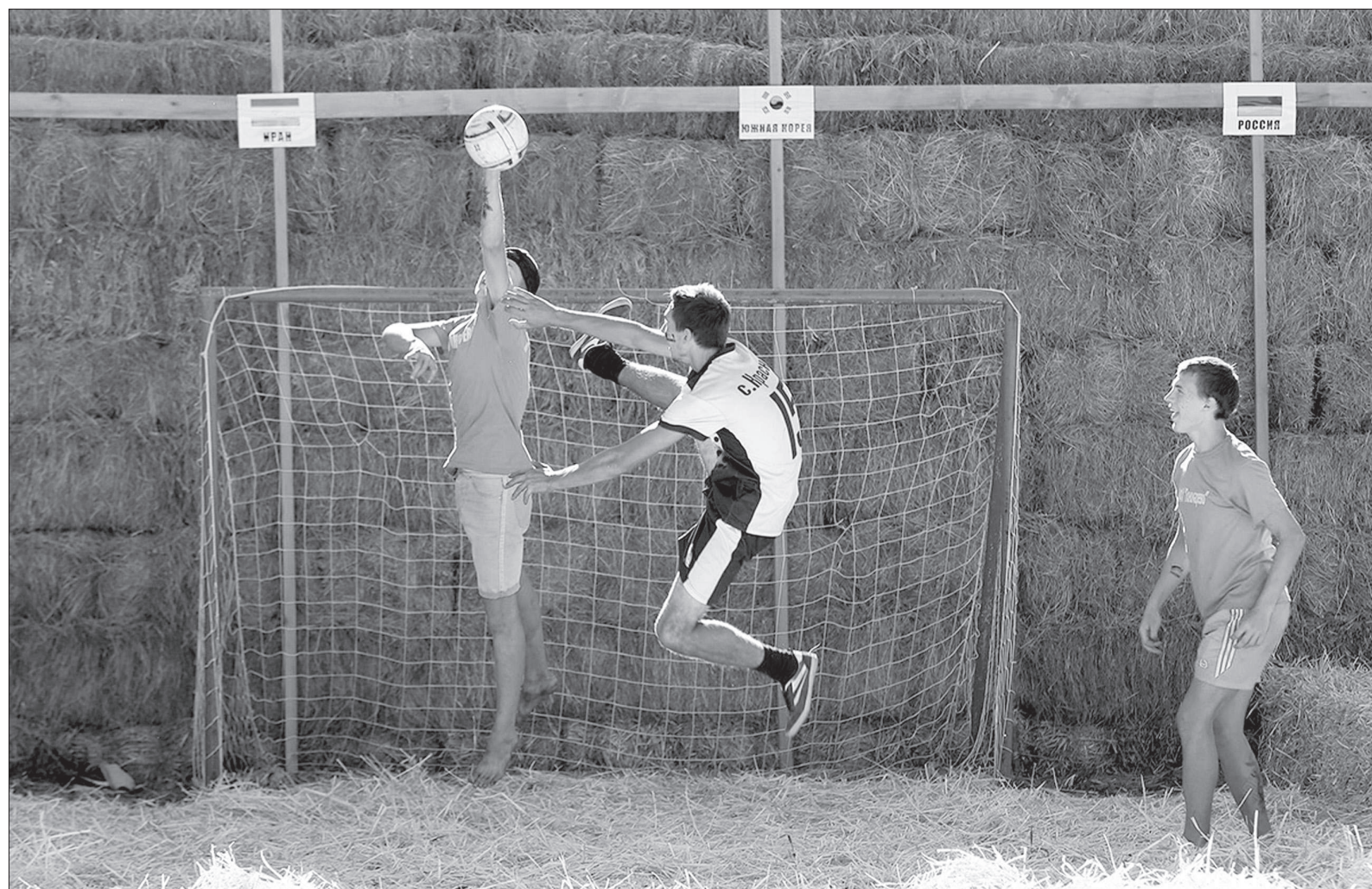
К чемпионату мира полностью готова и ставропольская «Зенит-Арена», где пройдут матчи по соломённому футболу. А вчера на стадионе можно было посмотреть на большом экране матч открытия мундиала Россия - Саудовская Аравия.

То, о чем восемь лет в футбольном мире с восхищением говорили мы и наши друзья и с нескрываемой злобой недоброжелатели, наконец свершилось! Впервые в нашей стране взял старт чемпионат мира по футболу.