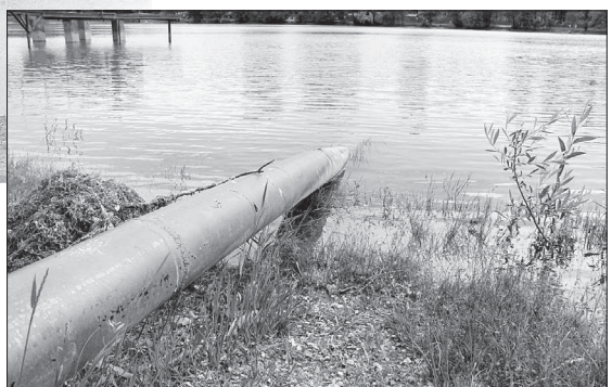
• Сегодня эта труба ведет в никуда.

Диссонанс в эту картину вносит состояние самих водоемов. Даже специалисту видно, что перепускные шлюзы, другая инженерная инфраструктура нуждаются в ремонте. Также назрела необходимость капитальной очистки прудов с полным