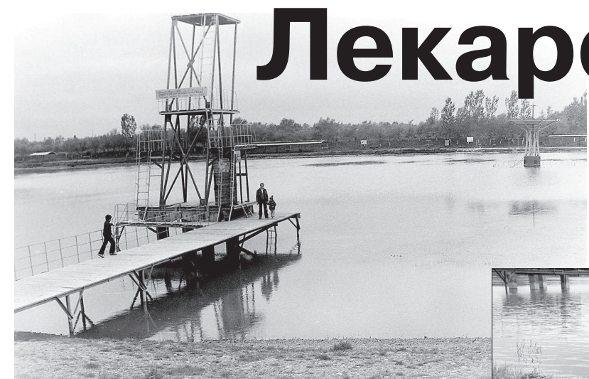
• Так выглядел когда-то городской пляж Невинномыска.

Если замучила жажда или проголодался? Никаких проблем! В пельменной рядом с пляжем можно было выпить бутылочку холодного лимонада, а затем отведать вкусных пельмешек со сметаной.