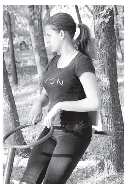
• К услугам любителей спорта уличные тренажеры

Пока этого не произошло, ежегодно подготовка пляжа к купальному сезону занимает все больше времени. И обычно стартует сезон не 1 июня, как должно быть, а ближе к третьей декаде месяца. Не исключение и этот год. Купаться в пруду будет разрешено не ранее 20 июня. Но сначала свое положительное заключе-