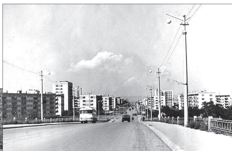
• Так выглядел путепровод в Невинномыске в 60-е годы прошлого века.