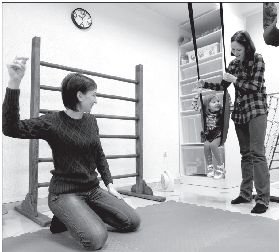
• Занятия в «Золотой пропорции» проходят с постоянными специалистами.

В Ставрополе при поддержке Российского благотворительного фонда «Рост содействие» и городской общественной организации инвалидов «Вольница» открылся центр лечебно-адаптивной педагогики и абилитации «Золотая пропорция»