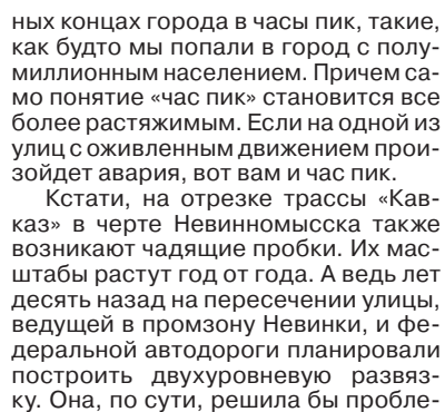
• Один из последних рейсов последнего в Невинномыске «Икаруса»-гармошки.