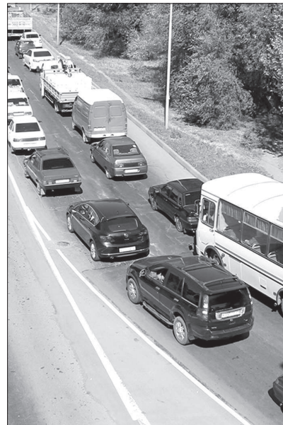
• Сегодня пробки в Невинномыске возникают не только в час пик.

К чему привело игнорирование инфраструктурных проблем? Во-первых, к пробкам. Хотя Невинномыск отнюдь не мегаполис. Здесь проживают порядка 117 тысяч человек. Но заторы, возникающие в раз-