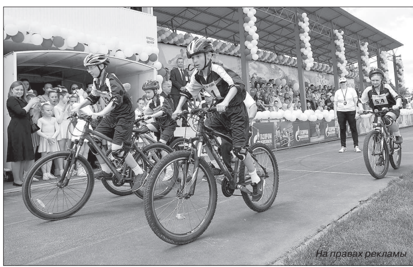
• Программа триатлона требовала от спортсменов-любителей хорошей выносливости.

Программа триатлона требовала от спортсменов-любителей хорошей выдержки. Утром в физкультурно-