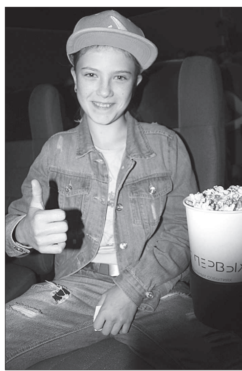
Впереди у детей работников АО «Невинномысский Азот» яркое, насыщенное событиями лето.

Сейчас впереди у детей химиков целое лето! Хорошо и интересно отдохнуть, завести новых друзей, съездить на море - об этом мечтают каждый ребенок. Администрация и профком «Невинномысского Азота» позаботились о том, чтобы мечты детей сотрудников воплотились в жизнь.