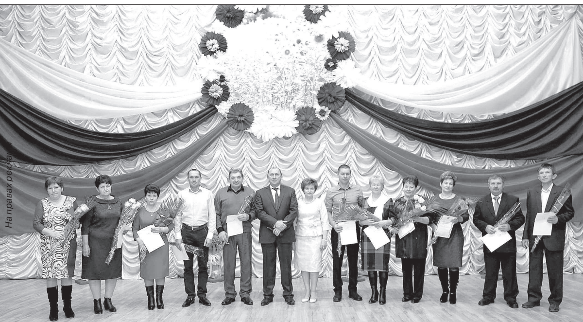
• Чествование лучших тружеников СПК колхоза имени Ворошилова Труновского района.

социальные объекты. Но председатель и коллектив считают иначе: государство не может полностью удовлетворить потребности сельчан, и помощь колхоза селу просто необходима.