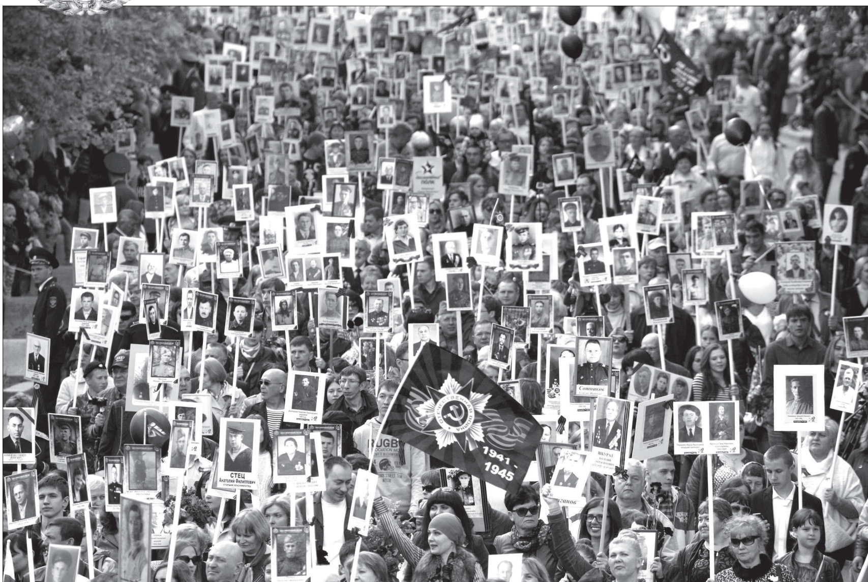
• Ставрополь, 9 мая 2016 года. Идет «Бессмертный полк». (Продолжение текста - на 2-3-й стр.).