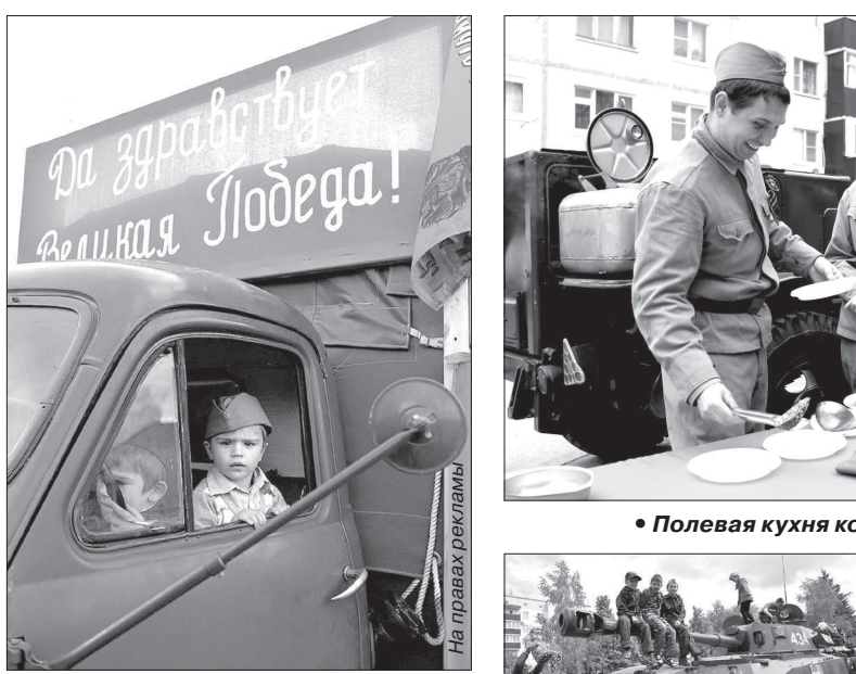
• Наследник Победы.

глядели как капли крови, напоминающая о том, какой ценой завоевана была свобода страны.