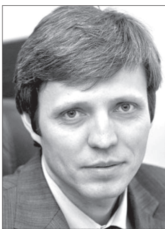
Василий Лямин, министр образования и молодежной политики Ставропольского края

ным оборудованием и автотранспортом на общую сумму более 75 млн рублей. В этих организациях в полном объеме создана универсальная безбарьерная среда. В сфере профессионального образования, сказал Василий Лямин, для Ставропольского края стало правилом участие в конкурсах Министерства образования и науки Российской Федерации. Так, успешное участие в конкурсно-отборном этапе в 2014-м привлекло из федерального бюджета субсидии в размере 49,5 млн рублей на модернизацию образовательного процесса и повышение уровня подготовки кадров для сферы «Сервис и туризм». В текущем году Ставропольский край, представленный 17 профессиональными образовательными организациями, вошел в десятку победителей открытого конкурса пилотных программ субъектов РФ, направленных на реализацию проекта «Подготовка рабочих кадров для социально-экономического развития регионов» на 2014-2019 годы. Реализация мероприятий пилотного проекта позволит в 2015 году привлечь в край из федерального бюджета в качестве субсидии около 1,3 млрд рублей. Это открывает возможности внедрять современные формы и методы обучения на новейшем высокотехнологичном оборудовании. Основными задачами, стоящими перед учреждениями профессионального образования в 2015 году, остаются внедрение инновационных образовательных технологий в условиях реализации Федеральных государственных образовательных стандартов; развитие социального партнерства и взаимодействия с работода-