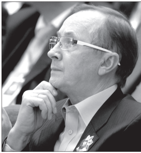
• Николай Бурляев.