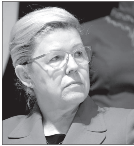
• Елена Мизулина.