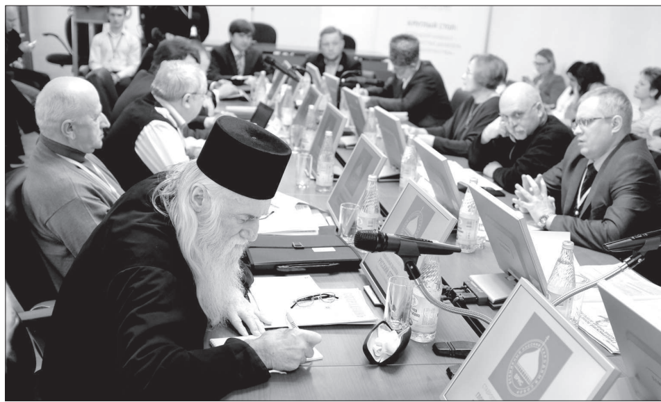
• На одном из круглых столов Собора.

лизации от самых ранних до нынешних времен есть неизменная формула нашего существования. Русский мир - не только русские, это все то, что складывается в эту потрясающую красоты и силы симфонию. Нам была когда-то вручена самая тяжелая часть земли - неудобная, топи, болота, без троп, без путей, и русский народ в крошечных трудах сражался за эти территории, «прожевывал» их, вводя в цивилизацию. В этой крошечной работе русское сознание никогда не смотрело только на землю, только в «котлованы», оно одновременно смотрело в небеса. Смысл русской истории, русского народа - в создании светосонных представлений о мире. В создании социума, который отвечал бы первоначальному эскизу, по коему Господь сотворил человечество. Господь создал человечество не для Манхэттена, не для банков, не для ваучеров, а для того, чтобы оно преобразовывало тьму в свет, страдания - в блаженство, адские силы исподней в райскую красоту. И сегодня мы встретились с невиданным столкновением божественного и адского, чудесного, космогонически светлого со страшным, космогонически темным. Образ Родины лучше всего определил наш великий поэт Хлебников: «Русь, ты вся - поцелуй на морозе, сияют ночные дорожки...»