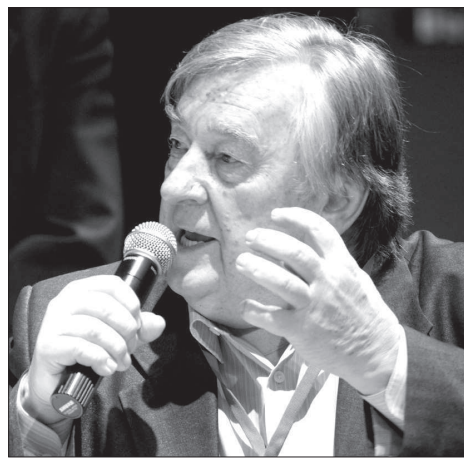
• Александр Проханов.