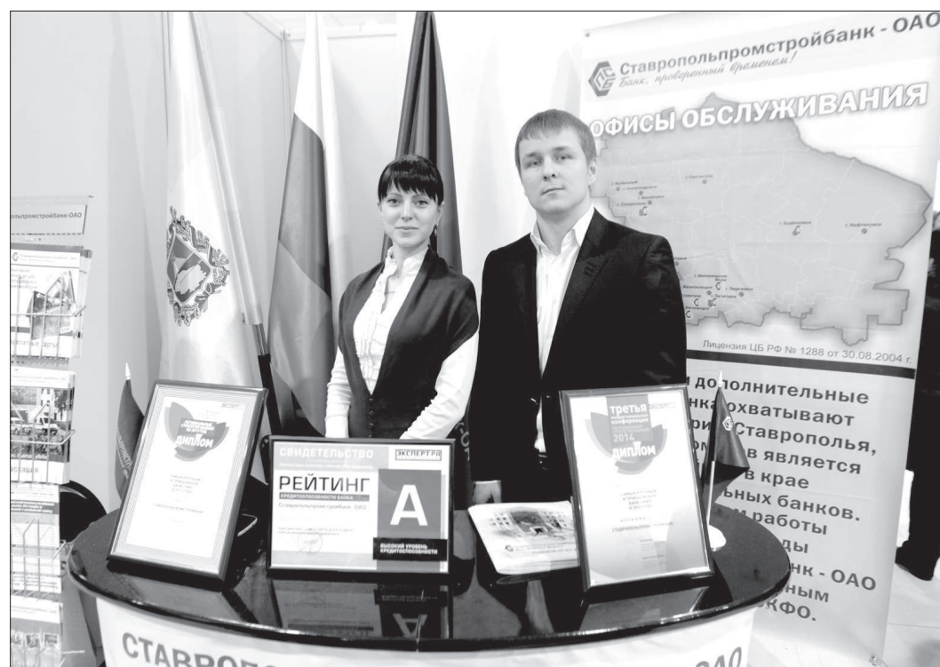
Лицензия ЦБ РФ № 1288 от 30.08.2004 г.