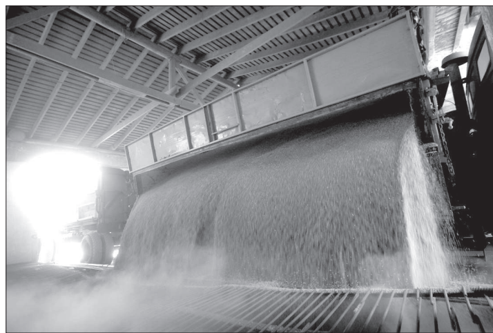
● На элеваторах работа по сохранности урожая не прекращается ни на один день независимо от того, активен сегодня зерновой рынок или нет.

зайствованном рынке продукции растениеводства в полном объеме минсельхозом проводится совершенствование структурной политики на фуражное зерно, ячмень, кукурузу и горох. С приоритетных задач - внедрение высокоэффективных и востребованных на рынке сельскохозяйственной продукции, сырья и продовольствия зерновых, масличных, технических, овошных культур и многолетних насаждений на основе современных эколого-безопасных ресурсов экологической технологии с учетом адаптивно-ландшафтных систем земледелия, а также ресурсосберегающих систем удобрения и защиты растений с использованием биологических методов воспроизводства почвенного плодородия, пояснили в отделе растениеводства.