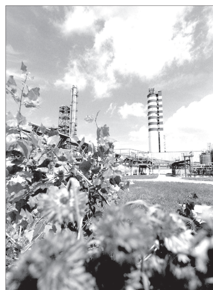
● Новые производства на «Невинномысском Азоте» приведут к снижению выбросов и улучшению экологической обстановки в городе и прилегающих районах.

Основные же отрасли потребления меламина - деревообрабатывающая, мебельная, строительная, лакокрасочная промышленности. Благодаря своим уникальным свойствам меламин служит ценным сырьем для получения многих экологических безопасных полимерных соединений, обладающих высокой механической прочностью, термо-