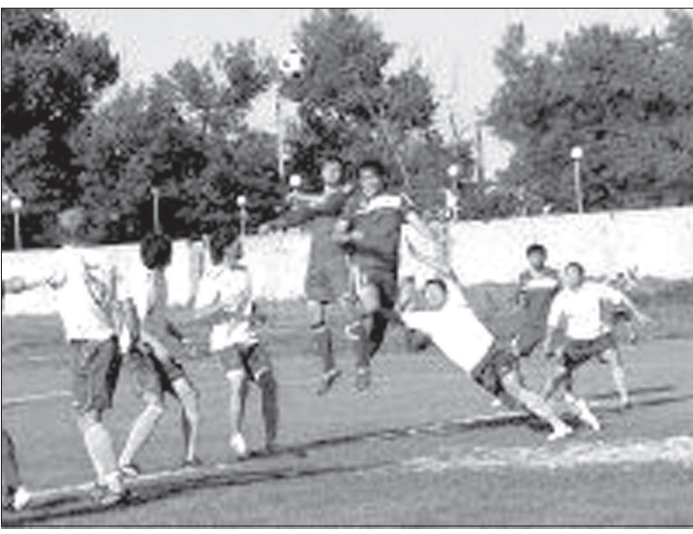
Фрагмент матча «Машука» с «Митосом».